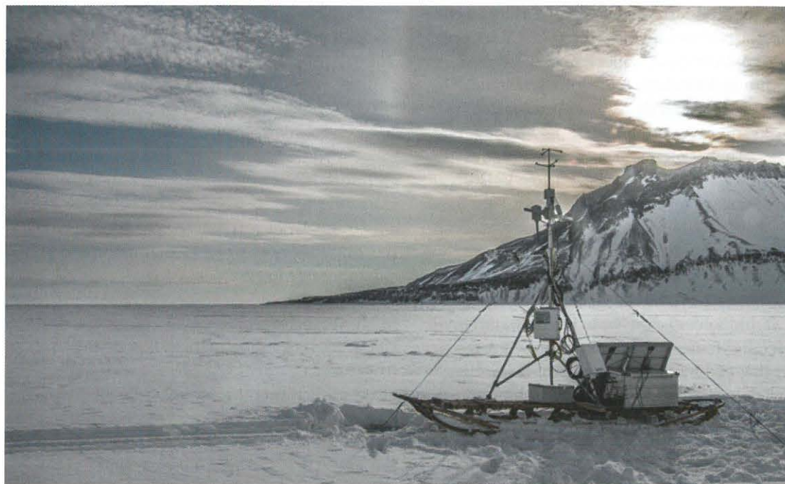
Figur 2: Vores Eddy Covariance tårn på tynd is (20 cm) i Nordøstgrønland.

forbinde de observerede udvekslinger med de helt grundlæggende aspekter af selve miljøet såsom udviklingen i temperaturer og energibalancen (Sievers et al. , 2015b; Sørensen et al. , 2014). Dette er en ydmyg start. Den overordnede ambition i hele feltet er dog knap så ydmyg: at gå endnu videre og formulere komplekse modeller til at beregne CO 2 udvekslinger for hele Arktis og Antarktis, så vi bliver bedre til at forudsige det fremtidige klima og undersøge vores indflydelse i dette yderst skrøbelige miljø mod nord.