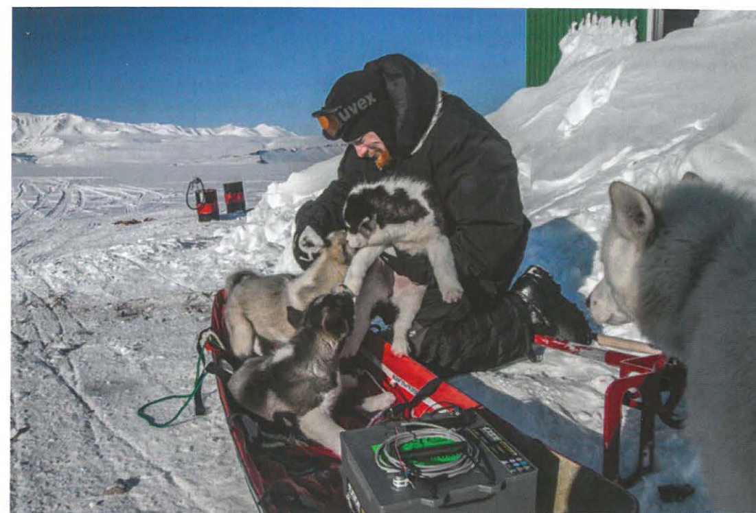
En uventet udfordring under arbejdet i Nordøstgrønland: Invasion af slædehundehvalpe!.