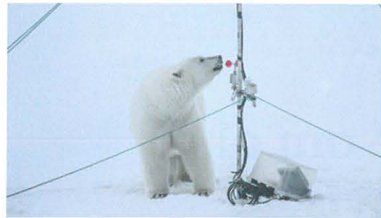
En nysgerrig isbjørn inspicerer et af vores instrumenttårne på havisen ud for Nordgrønland.

samme intuitive indstilling har drevet forskere til igennem årtier at opfatte havisen som et kæmpe låg over havet, når